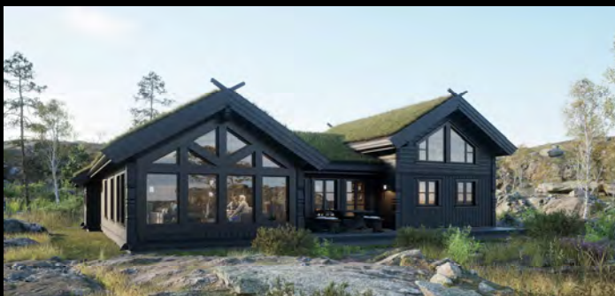
Skeikampen med garasje