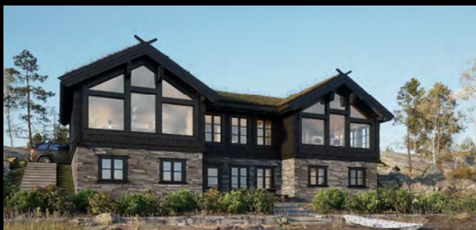
Skeikampen med kjeller